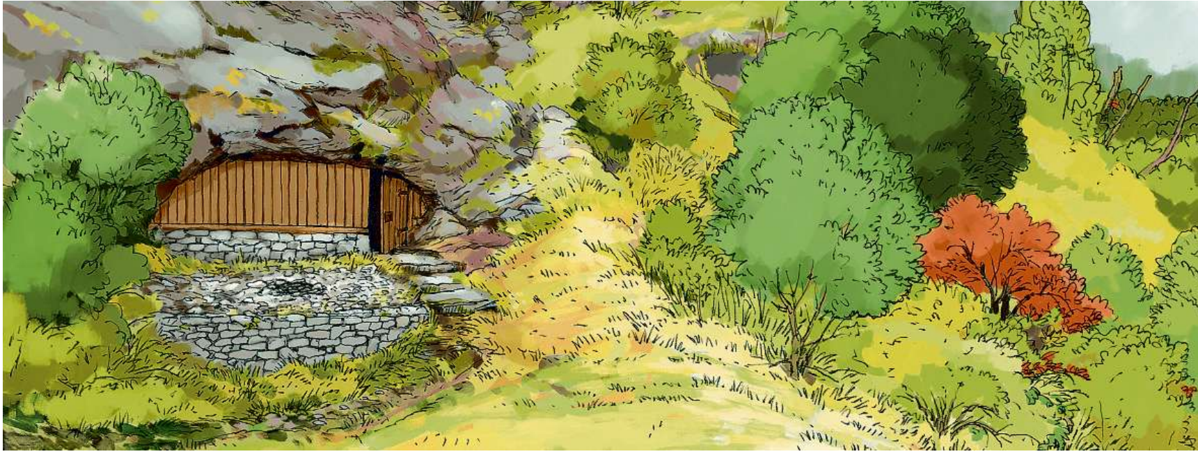
Ascheia pudess la tàna da Ziràn aver sapeschanto sco sanctuari roman antoc'igl 5avel tschantaner.

DISSEGN: BUNTERHUND ILLUSTRATION, KOLLEKTIVGESELLSCHAFT, TURITG