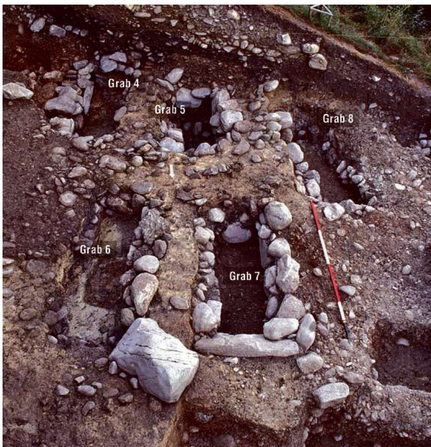
Vesta sen las fossas fatgas sen la plaza davànt la tàna, davent digl 6avel antoc'igls 10avel tschantaner.

Igls auturs digl cudesch safatschaintan intensivameing cun l'amparada, tge fun-